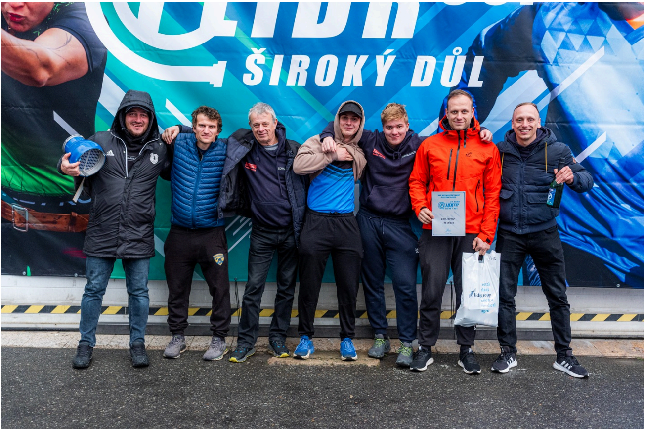
Družstvo mužů na soutěži v Širokém Dole.

Členové SDH následně schválili Plán činnosti na rok 2026. Hlavním úkolem v roce 2026 pro nás bude uspořádání oslav ke 140. výročí založení našeho sboru. Toto výročí bychom chtěli oslavit společně s občany ke konci června 2026. Dále jsme do plánu mimo jiné zařadili únorové posezení s důchodci, čarodějnické řízkování, v měsíci červnu soutěž v požárním sportu v rámci Benešovské hasičské ligy a