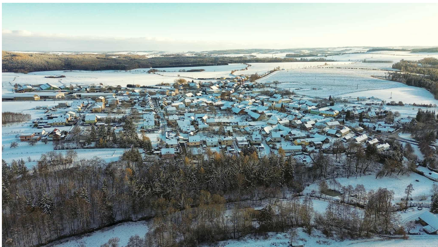
Zdislavice pod prvním sněhem 28. 11. 2025.