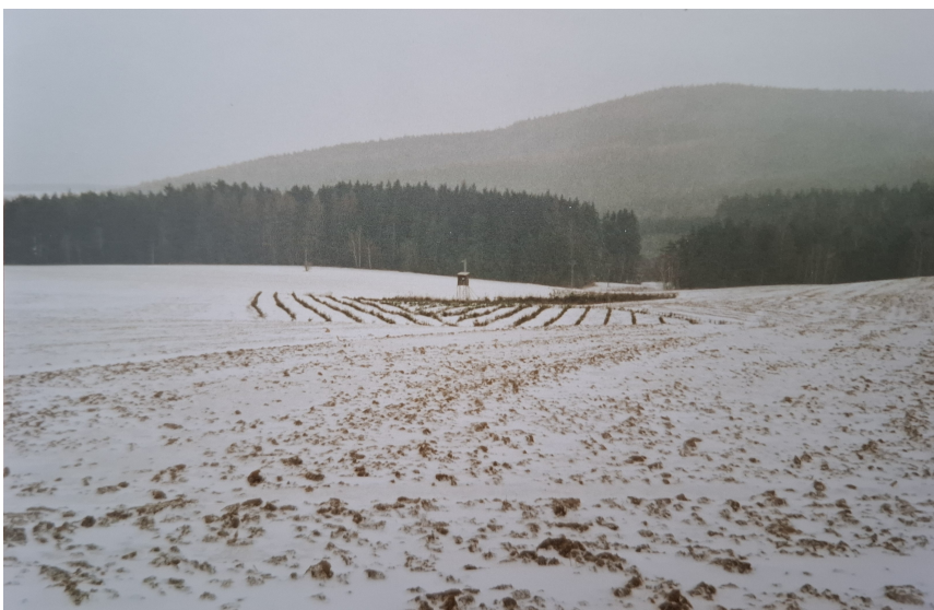
Pohled na Vojslavský dolík od cesty na "Židák", foto z ledna 2000.

Myslivecký spolek má v současné době 19 členů a jednoho mysliveckého adepta. 15 členů je držitelem platného loveckého lístku a zbrojního průkazu, kteří vykonávají právo myslivosti.