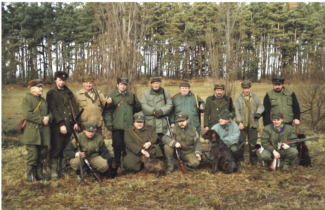
"Pod Padělkem", v místě dnes Židova rybníka, foto 8. 12. 2001.