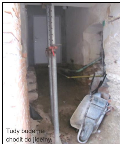
Tudy budeme chodit do jídelny.

Od příštího školního roku budeme tedy mít „skoro“ novou školu. Připravujeme slavnostní otevření nového vchodu a Den otevřených dveří, aby se všichni mohli přijít podívat.