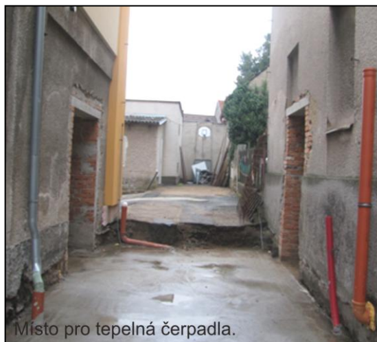
Místo pro tepelná čerpadla.

Aby toho nového bylo více, máme ve školní družině nový moderní nábytek. V mateřské školce je v malé třídě rovněž nový nábytek a čekáme na instalaci šesti nových herních prvků na zahradu. Další dva prvky bychom chtěli koupit z dotace kraje.